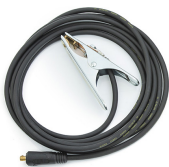
Earth return cable 5 m, 25 mm 2