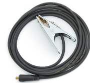
Earth return cable 10 m, 25 mm 2